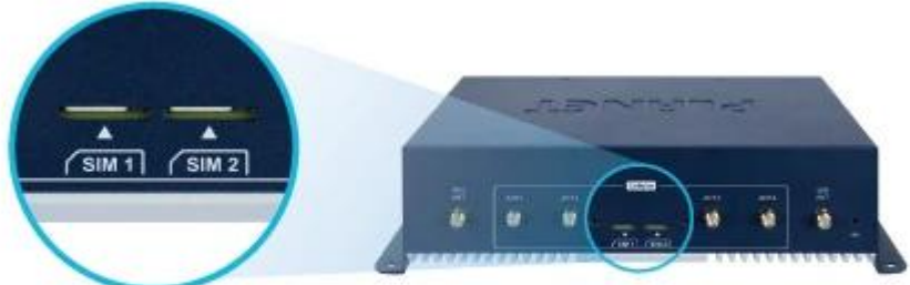
Dual 5G NR