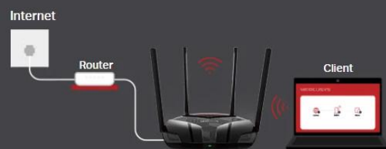
Access Point Mode

Creates a wireless network for all your WiFi devices