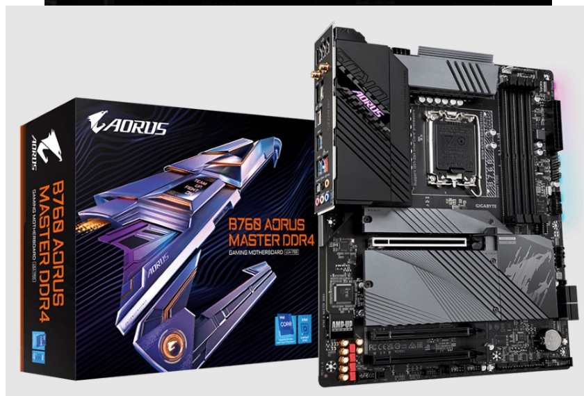
GIGABYTE B760 AORUS MASTER DDR4