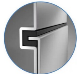
Sealed Lock-and-Key Design

Na zadní straně je k dispozici celá řada portů, mezi nimiž vyčnívá především rozhraní HDMI 2.0 , které zajistí snadné promítání 4K obsahu při vyšším jasu a kontrastu oproti standardnímu rozlišení. Jas je klíčem k viditelnosti. I proto nabízí projektor BenQ LU9245 funkci dynamického tlumení jasu dle scény a optimalizuje světelný výkon a kontrast pro co nejlepší obraz.