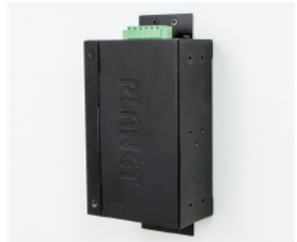
Side Wall Mounting (Space saving)