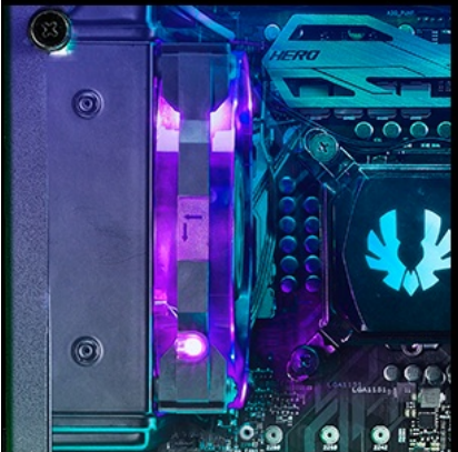
120mm ( radiator )